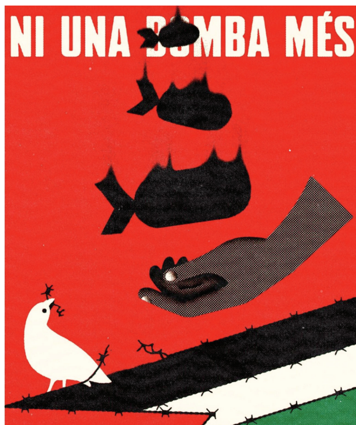
Cartellera de la campanya “Prou comerç d'armes amb Israel”.

No és cap secret que l'increment de la inflació dels darrers anys hi està lligada . El 10,4% de 2022