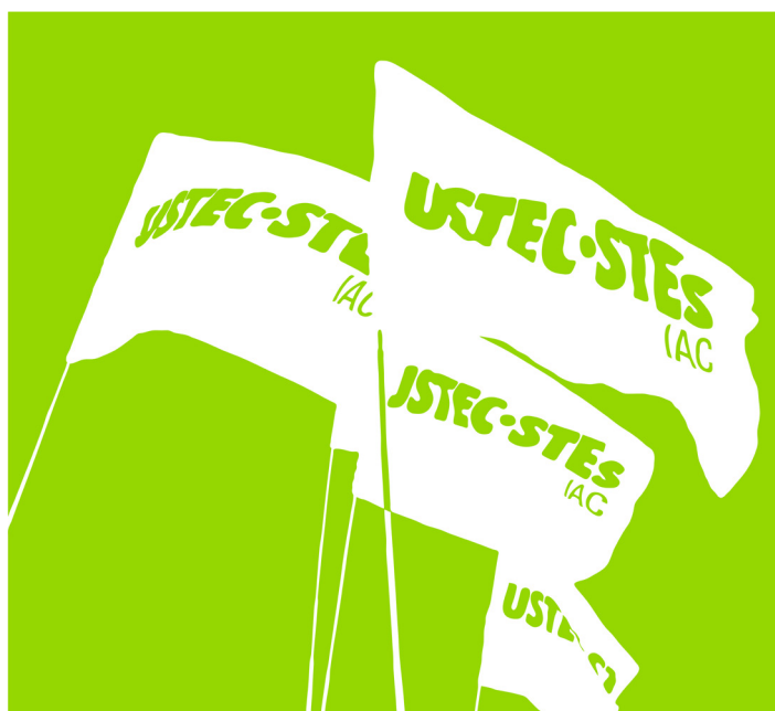
Evolució de delegats/des 2019-2023