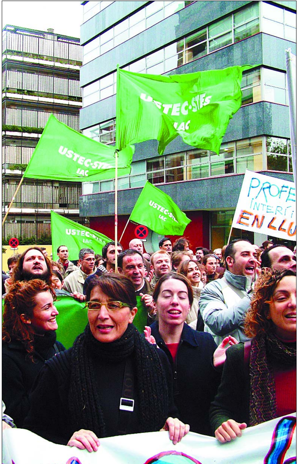
Concentració davant el Departament d'Educació, durant la jornada de vaga

ral del professorat interí/substituit i el contingut d'aquest Acord. Finalment, demanem al Departament d'Educació i a les organitzacions sindicals signants que reflexionin sobre l'acte poc democràtic que duran a terme en excloure USTEC·STEs de la comissió de seguiment d'aquest acord pel fet de no signar-lo.