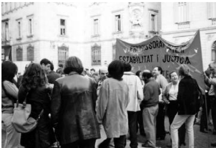
Concentració de professorat interí i substitut el 18 d'octubre a la pl. Sant Jaume de Barcelona

En aquesta nòmina del passat setembre, a més de consolidar aquest increment de 4.702 ptes. en nòmina, ens van pagar els endarreriments dels 8 mesos anteriors, la qual cosa equival a 37.616 ptes. brutes. Aquest fet suposa un increment generalitzat en la nòmina de setembre de 42.318 ptes. brutes. El personal interí i substitut consolidarà també l'increment mensual i cobrarà els endarreriments en proporció al temps treballat a partir de l'1 de gener del 2000. Això afecta tant als de mitja jornada com als de jornada sencera. En el cas de no haver-los cobrat aquest mes de setembre cal fer la reclamació al Departament de Personal.