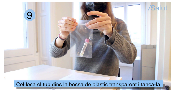
Col·loca el tub dins la bossa de plàstic transparent i tanca-la