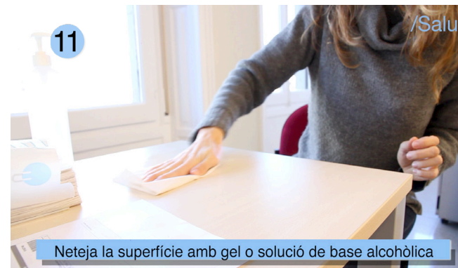
Neteja la superfície amb gel o solució de base alcohòlica