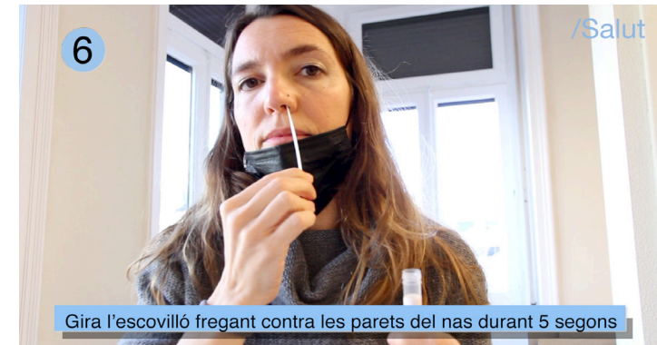
Gira l'escovilló fregant contra les parets del nas durant 5 segons