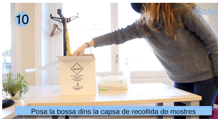
Posa la bossa dins la caps de recollida de mostres