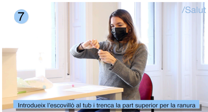
Introdueix l'escovilló al tub i trenca la part superior per la ranura