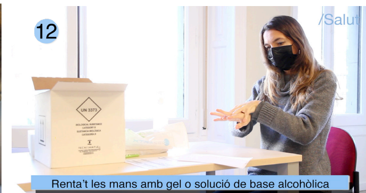
Renta't les mans amb gel o solució de base alcohòlica