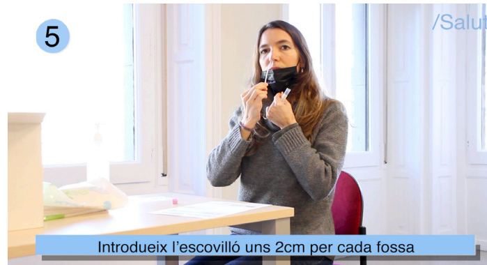
Introdueix l'escovilló uns 2cm per cada fossa