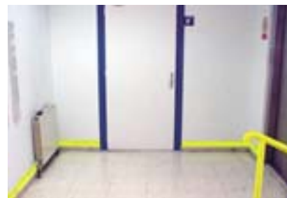
El contraste de colores facilita la movilidad