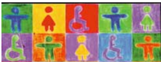
Ilustración de Marina Wiriltsch, Año Europeo de las Personas con Discapacidad 2003

Las personas con discapacidad deberían recibir un tratamiento equitativo en el trabajo, en particular en materia de seguridad y salud en el trabajo. La seguridad y la salud no deberían utilizarse como pretexto para no emplear o dejar de emplear personas con discapacidad. Además, un lugar de trabajo accesible y seguro para personas con discapacidad también resulta más seguro y accesible para todos los trabajadores, clientes y visitantes. Las personas con discapacidad están protegidas tanto por la legislación en materia de lucha contra la discriminación como por la legislación sobre la seguridad y salud en el trabajo europeas. Estas leyes, que los Estados miembros incorporan a las legislaciones y disposiciones nacionales, deberían aplicarse para facilitar la contratación de personas con discapacidad, no para excluirlas.