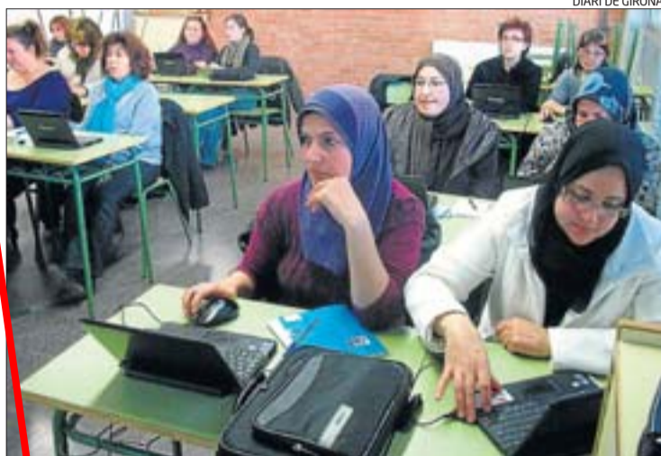
DIARI DE GIRONA

► Acompanya la Dora i el seu amic Botes en cinc divertides aventures per llegir i per jugar. Els títols són: La Dora tenia un xaïet , La Droa escala la muntanya Estel , El tresor antic , La Dora i en Botes a la festa de la Daisy i Busquem en Botes . | DdG