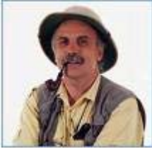
Eudald Carbonell Arqueòleg i professor Universitat Rovira i Virgili Codirector del Projecte Atapuerca